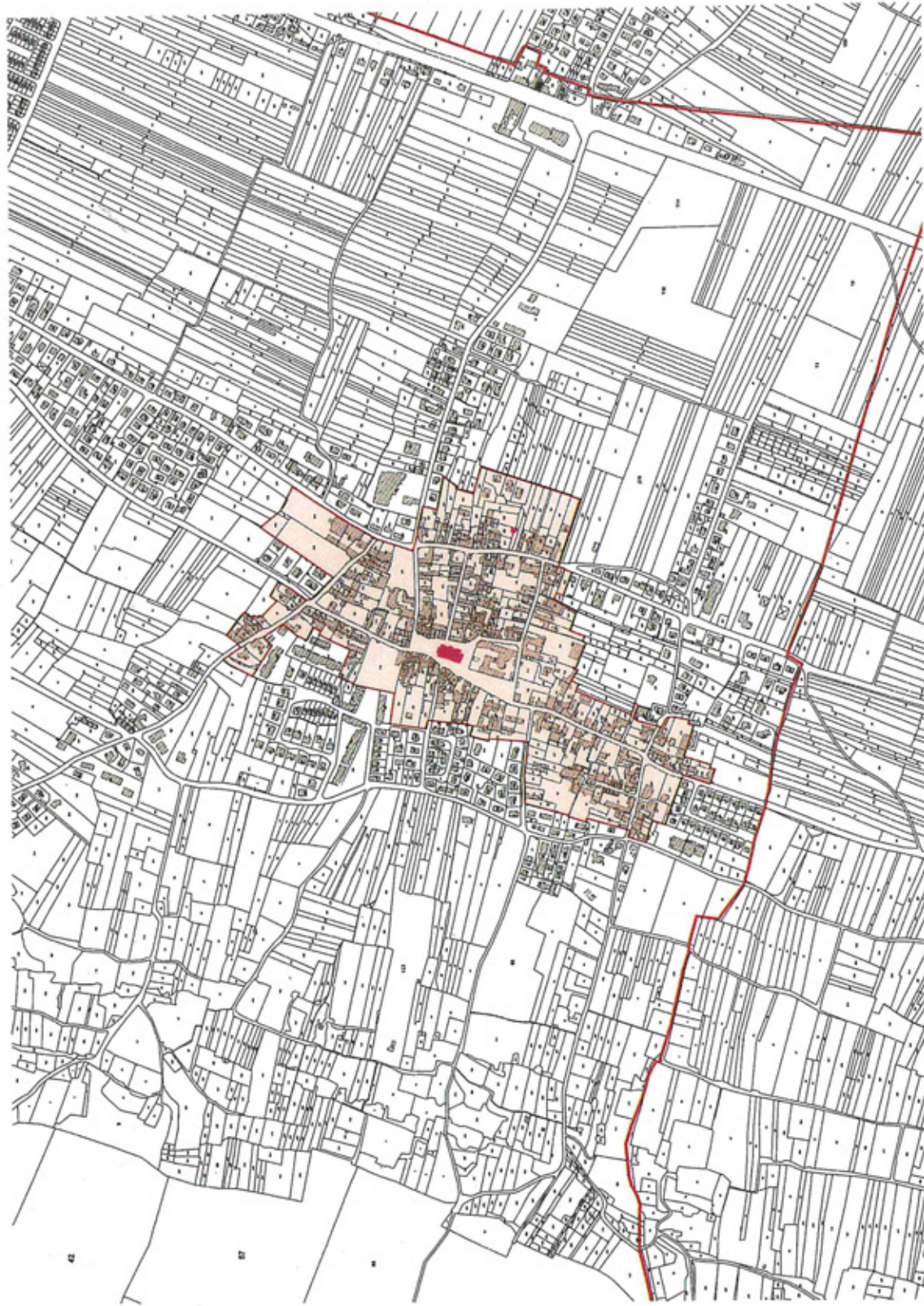
Proposition de périmètre délimité des abords de l'église Notre-Dame-de-l'Assomption et du colombier à MARSANNAY-LA-COTE