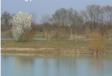
Un étang parmi d'autres